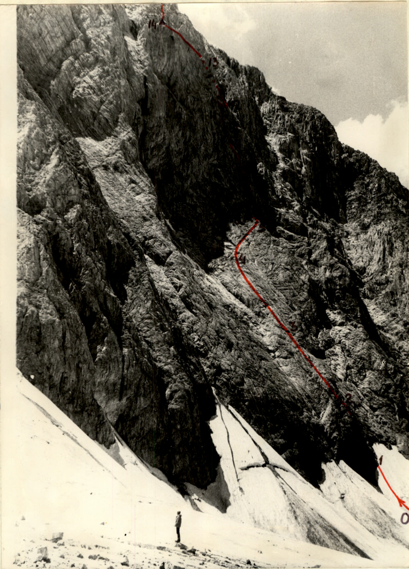
Профиль Восточной стены.