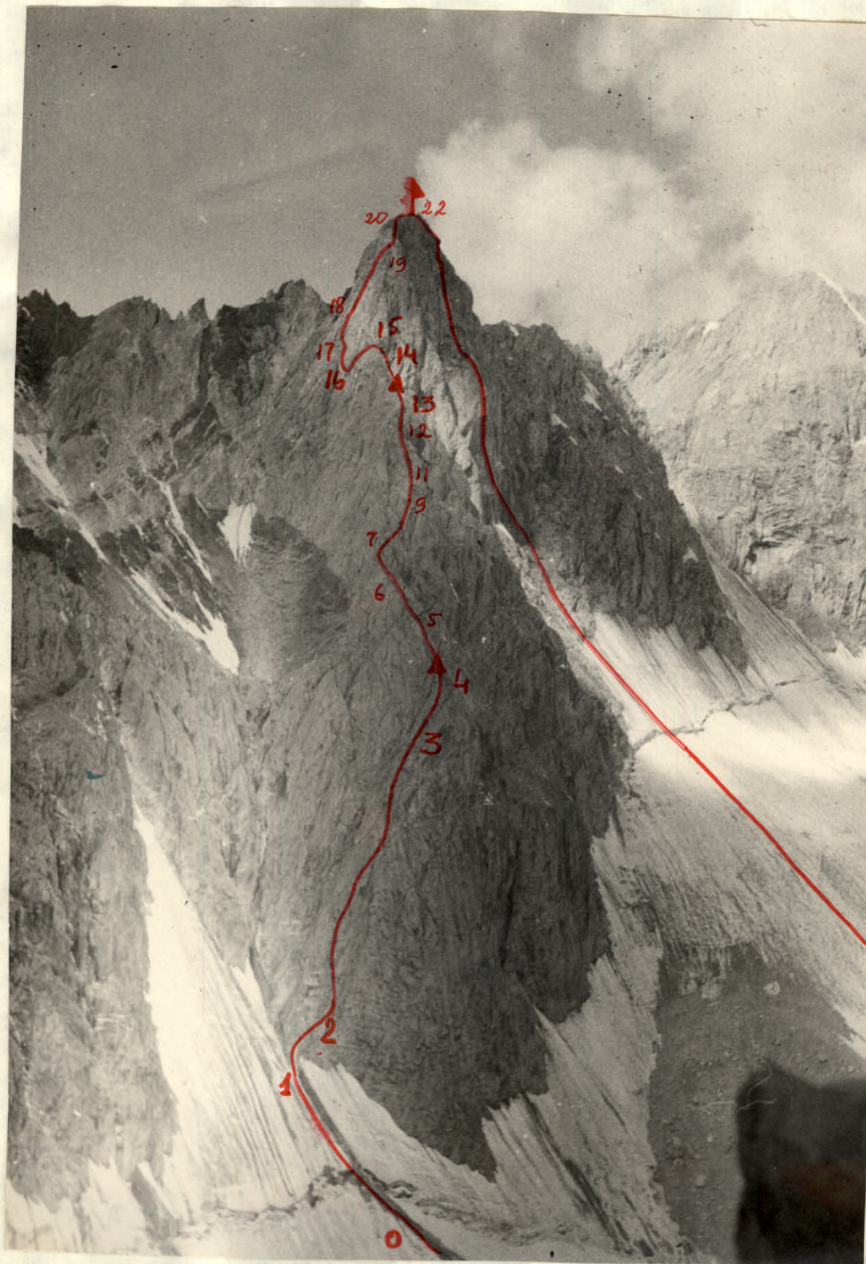
Общий вид маршрута пик Поповича по Северо-Восточному ребру.