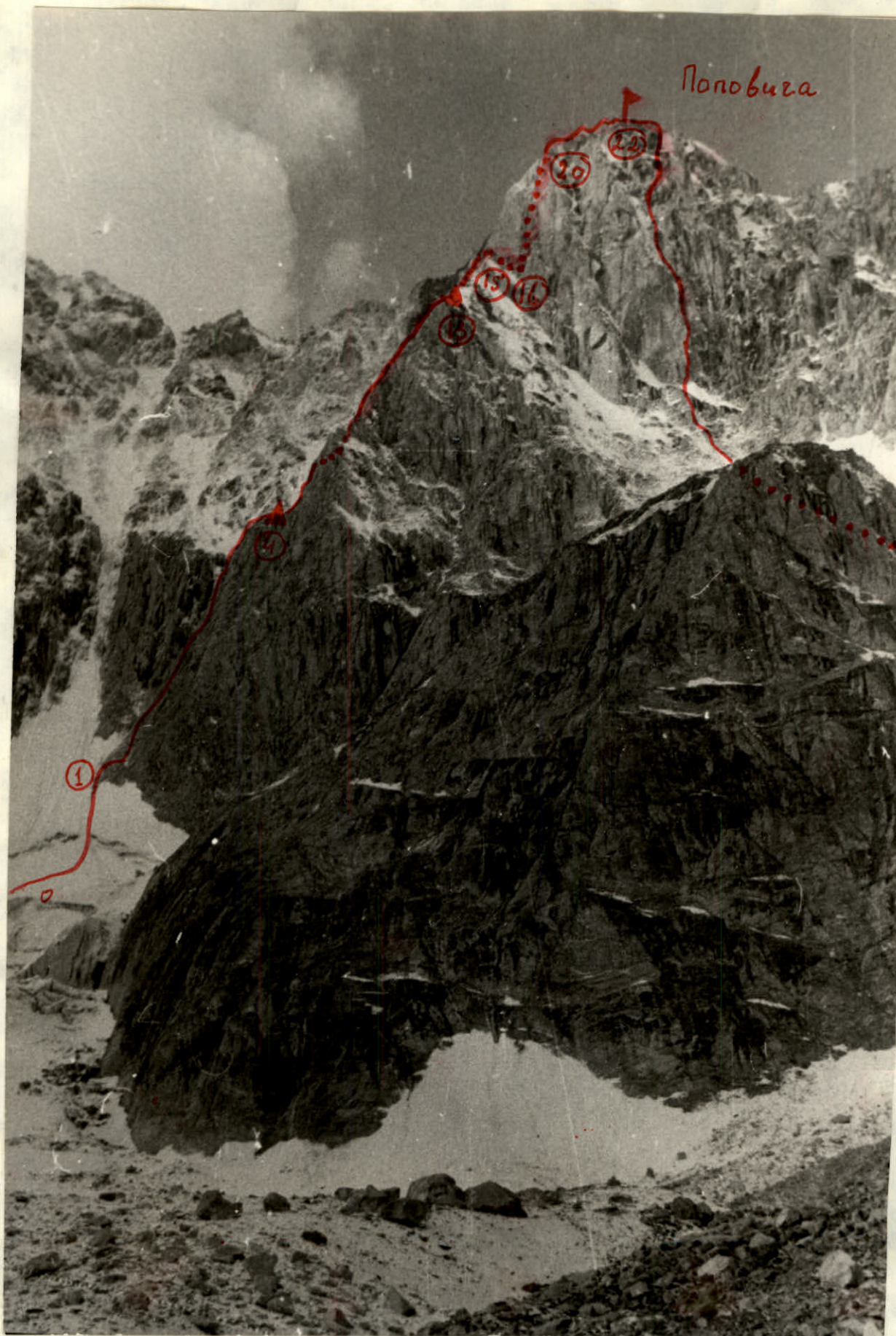
Фротография профіля маршрута.